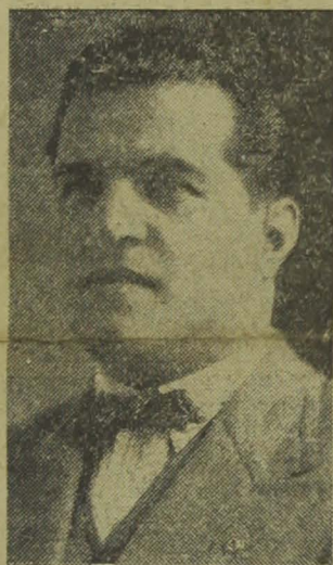
Deputado Baptista Luzardo

Publicamos a seguir o discurso proferido pelo deputado Baptista Luzardo, no grande comicio de domingo da sacada da Escola Normal.